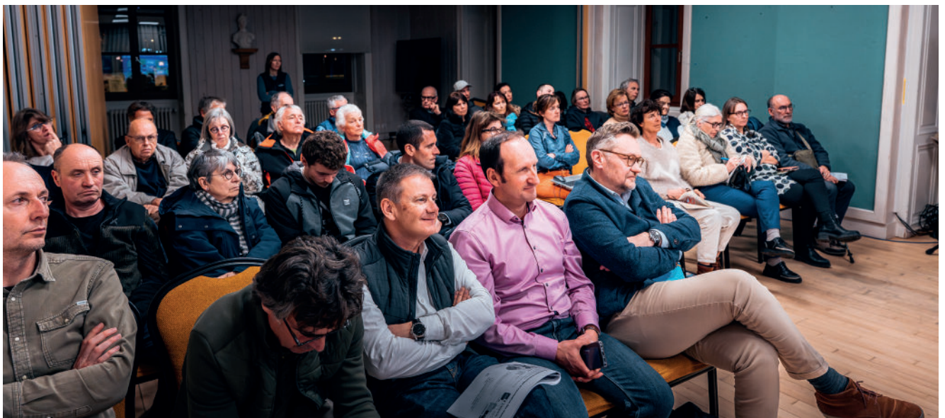
Le public présent

Les prescriptions du SCoT intègrent également la nécessité de préserver les espaces agricoles et naturels.