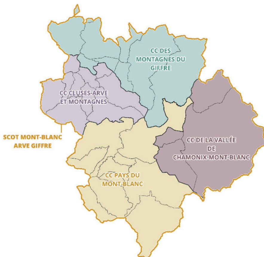
Les 4 EPCI constitutives du SCOT Mont-Blanc

La présentation a duré 51 minutes. Le présent compte rendu se concentre sur les échanges qui ont suivi.