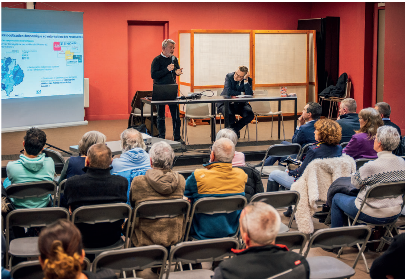
Le public présent à la salle des Allos