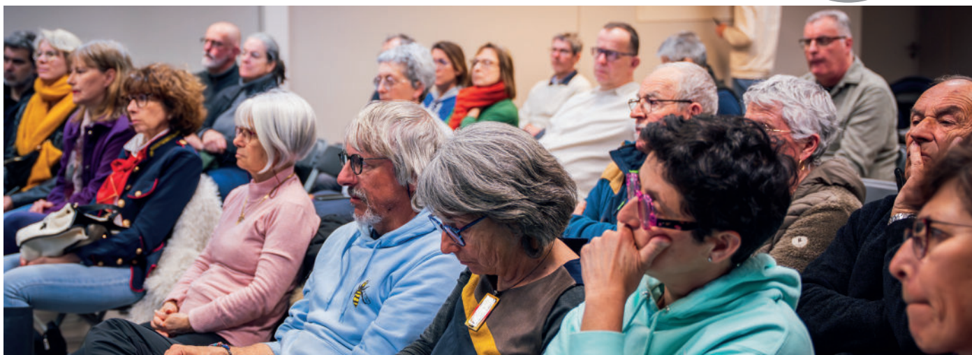
Le public présent le 6 mars pour la réunion publique à Cluses